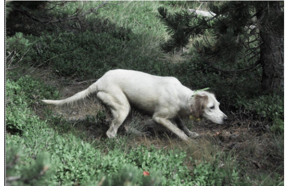
Chien d'arrêt au travail. Lorsqu'il a repéré une perdrix ou un grand tétras, il se fige. Un bon chien d'arrêt est un auxiliaire indispensable pour le suivi de certaines espèces.