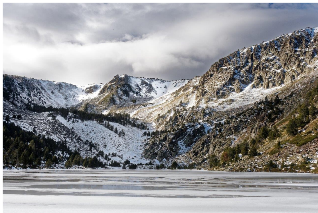
Le Gorg Estelat en hiver