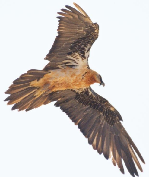
Parmi les missions confiées à Nans, le suivi de la reproduction du Gypaète barbu