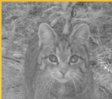
Une célébrité internationale

Directeur de la publication : Laurent Espinet