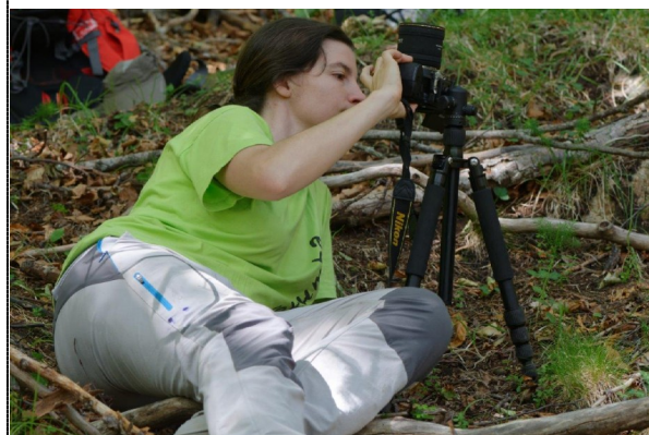
Coopération transfrontalière au service de la préservation de la flore pyrénéenne...

* POCTEFA : Programme européen Opérationnel de Coopération Territoriale entre l'Espagne, la France et l'Andorre.