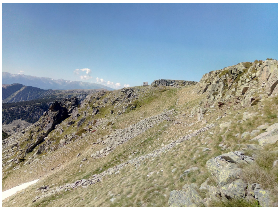
Les hauteurs de la réserve lors du suivi des oiseaux de haute montagne