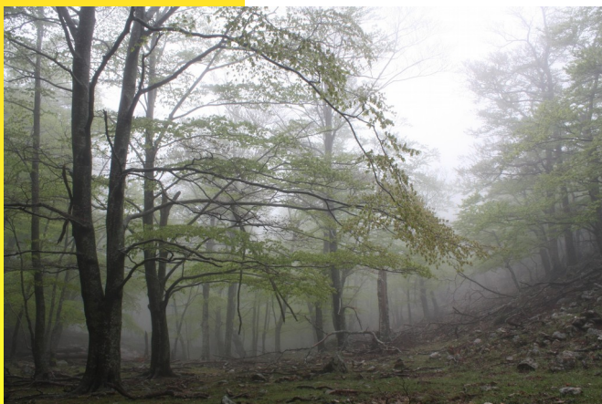
Fraîcheur forestière, (Photo O.S.)

I l ne sera pas dit qu'à Nohèdes, l'année 2020 aura été une année comme les autres !