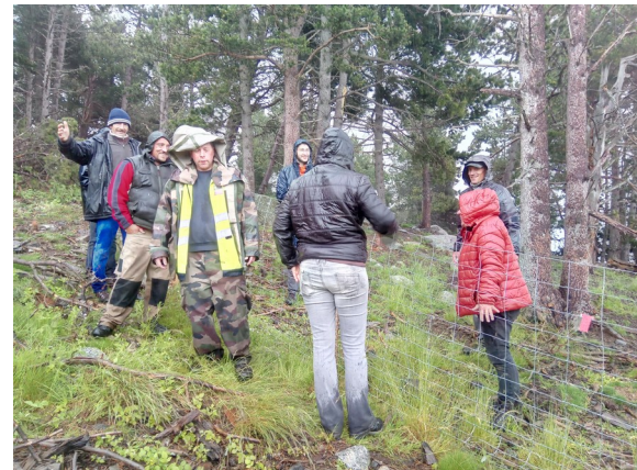
Installation des visualisateurs, sous la pluie et dans la bonne humeur