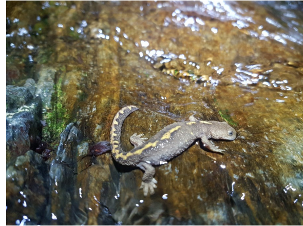
Un beau Calotriton ce printemps